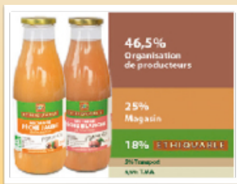
Jus de Pêche Jaune et Blanche du Roussillon (3,20 €)