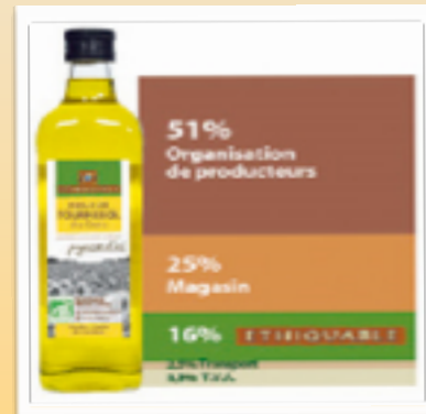
Huile de Tournesol du Gers (5,10 €)

D'autres nouveaux produits de chez eux : Nectar de Litchi (3,40 €) et Nectar de Citron Vert (2,80 €) en packs.