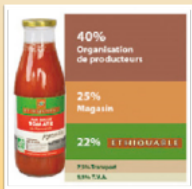
Jus de Tomate de Marmande (2,50 €)

Tout le monde connaît maintenant ETHIQUABLE : nous distribuons déjà des produits venant de chez eux. Comme AlterEco, Ethiquable choisit de s'orienter vers le commerce équitable Nord-Nord et français.